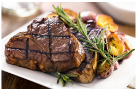
Boeuf grillée ou rôtie